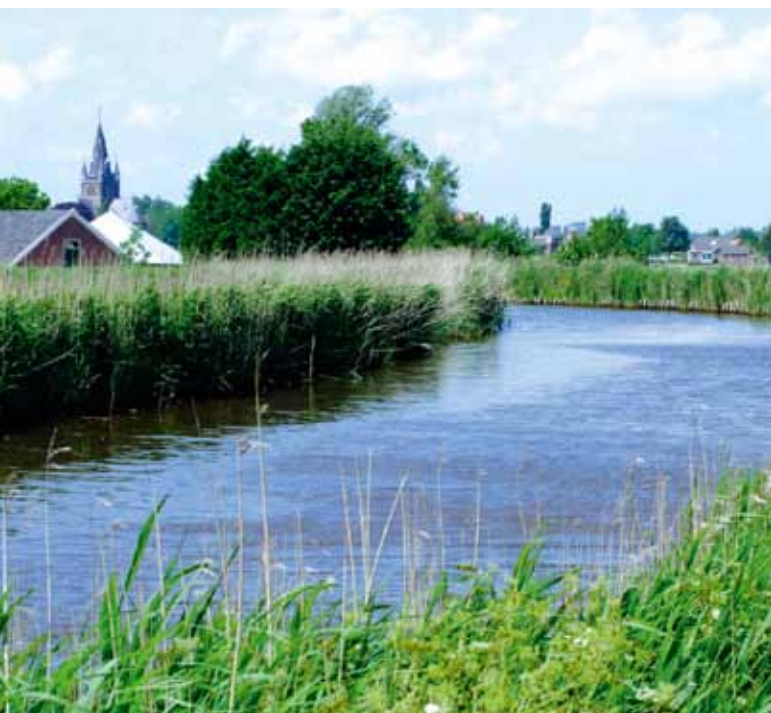
Rivier de Bullewijk in polder de Ronde Hoep.

In drie jaar tijd zijn meer dan 3100 schadeberekeningen met de WSS uitgevoerd: een mooie score. Een bijzonder voorbeeld van het gebruik van het instrument is er één door Waternet voor de Bovenkerkerpolder en de naastgelegen polder Ronde Hoep. Hier werden met WSS schadeberekeningen uitgevoerd, waarbij het waterpeil steeds met 5 cm werd verhoogd. Op die manier kreeg Waternet een antwoord op de vraag bij welke waterstanden de schade echt flink gaat oplopen. Op basis van dergelijke berekeningen tussen naastgelegen polders, kunnen waterbeheerders een afweging maken waar je overtollig water het best kunt bergen.