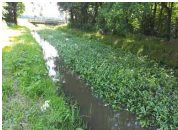
Stroomdal van de Kleine Beerze, Brabant.

Inmiddels is BOWA, net als de Waterschadeschatter, beschikbaar als internetapplicatie, zodat iedereen altijd beschikt over de meest actuele versie en het niet nodig is zware toepassingen op de eigen pc of het eigen netwerk te installeren. STOWA heeft een speciaal portaal geopend - www.stowaportaalwateroverlast.nl - waar gebruikers alle instrumenten over wateroverlast kunnen vinden.